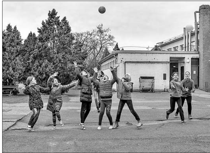
Az önkormányzat az idén felújítja az iskola udvarát.

A hivatali dolgozók vonatkozásában pedig 2017. január 1-től, 22,2%-os bérfelállításra tettem