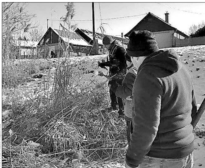
A horgászok irtották a nádat a tó szélén

– Januárban vágtuk a nádat, négy hétvégi napon ment le az egyesület néhány tagja, és elvé-