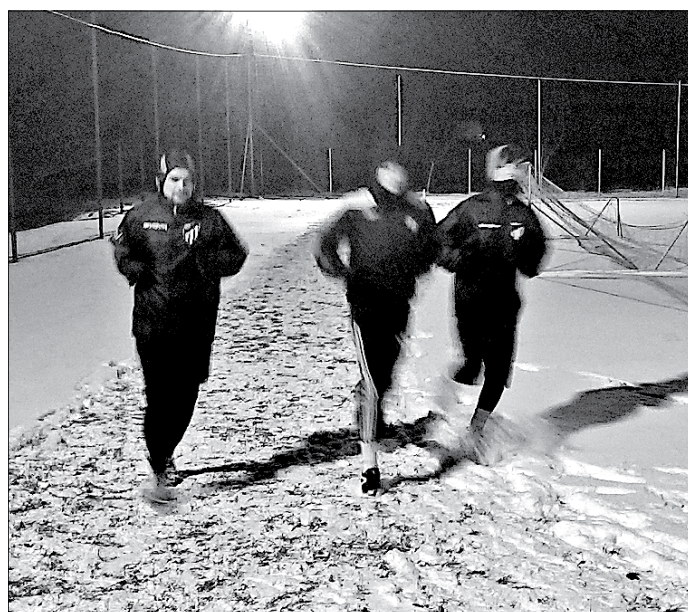
A hó, a hideg sem akadályozhatta a csapat felkészülését.

– Jelenleg nem. Nem érkezett, és nem távozott senki. Az átigazolási időszak február 24-ig tart, tehát még akár lehet is játékos mozgás. Ha C. Ronaldo, vagy