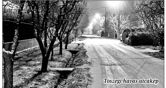
Tószegi havas utcakép