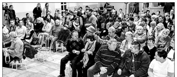
Kép és szöveg: Pivniczki Rajmond