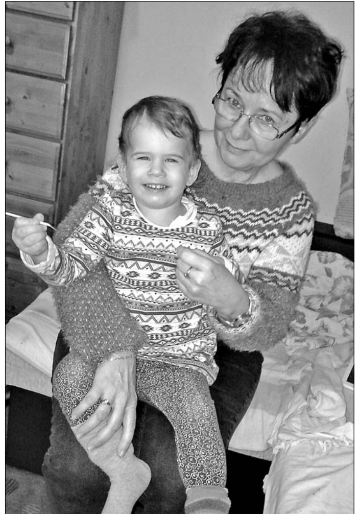
A nyugdíjas tanárnő kedvenc időtöltése: unokájával játszik

Hogyan lehet a matematikát megszerettetni, sokak számára mumust jelent ez a tantárgy – faggattuk a pedagógust. Azt mondta, tényleg vannak, akik nagyon nem értik, de őket is meg lehet fogni, szeretettel, a személyre szabott feladatokkal. Türellemmel, biztos szakmai tudással, gyerekszeretettel ren-